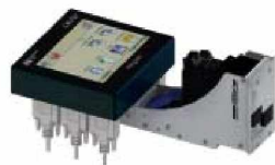
MT-HP4 KOMPAKTE EINHEIT MIT 2 DRUCKKÖPFEN (1")