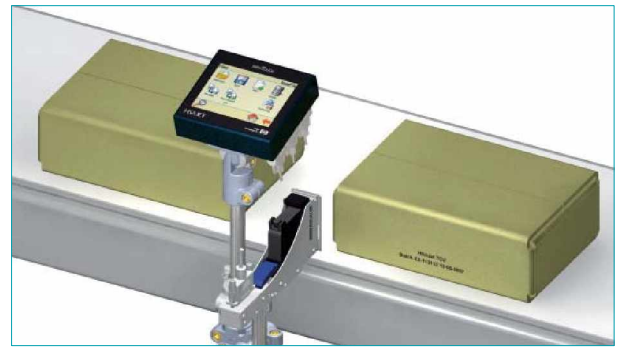
DAS MONTAGEZUBEHÖR IST IN VERSCHIEDENEN KONFIGURATIONEN ERHÄLTlich.